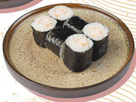
С тигровыми креветками рис / креветки / нори 105 г 181.-