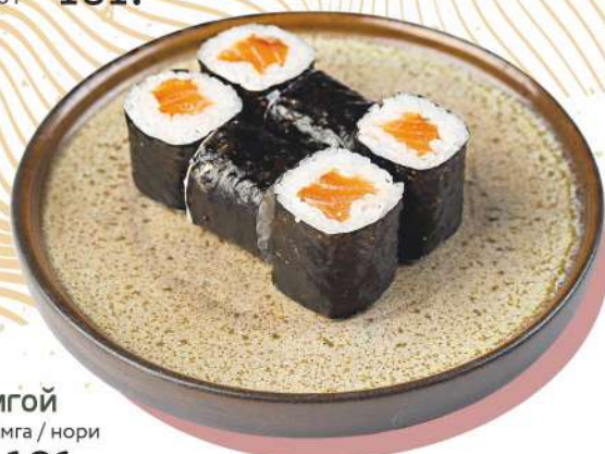
С семгой рис / сёмга / нори 105 г 191.-