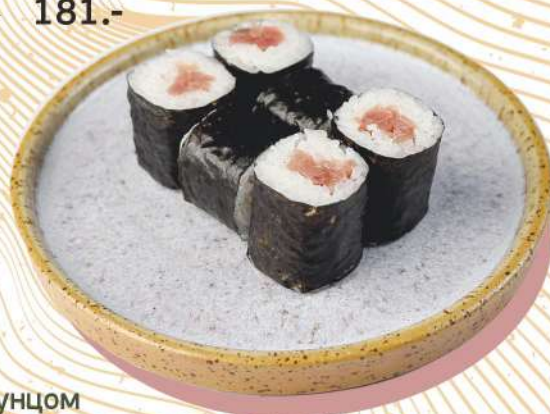
С тунцом рис / тунец / нори 105 г 181.-