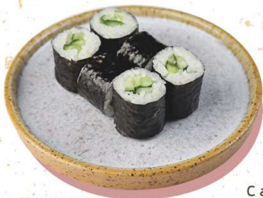
С огурцом рис / огурец / нори 105 г 111.-