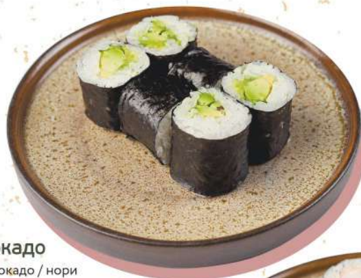
С авокадо рис / авокадо / нори 105 г 131.-